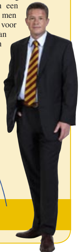
Frank Vanhecke Voorzitter Vlaams Belang

Het Vlaams Belang zal luidop blijven zeggen wat de meerderheid van de Vlamingen denkt. Tot spijt van wie 't benijdt!